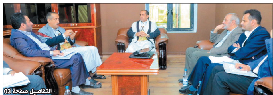
التفاصيل صفحة 03