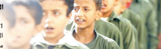
البقية صفحة 04

الثورة / أطلقت وزارة التربية والتعليم التقويم الدراسي للعام 2020- 2021م وقد استقبل الطلاب الخبر بحفاوة إبتهاجاً بعودة الدراسة بعد توقف اضطراري بسبب جائحة كورونا وسط مخاوف من ازدياد الفصول الدراسية وعدم التزام الطلاب