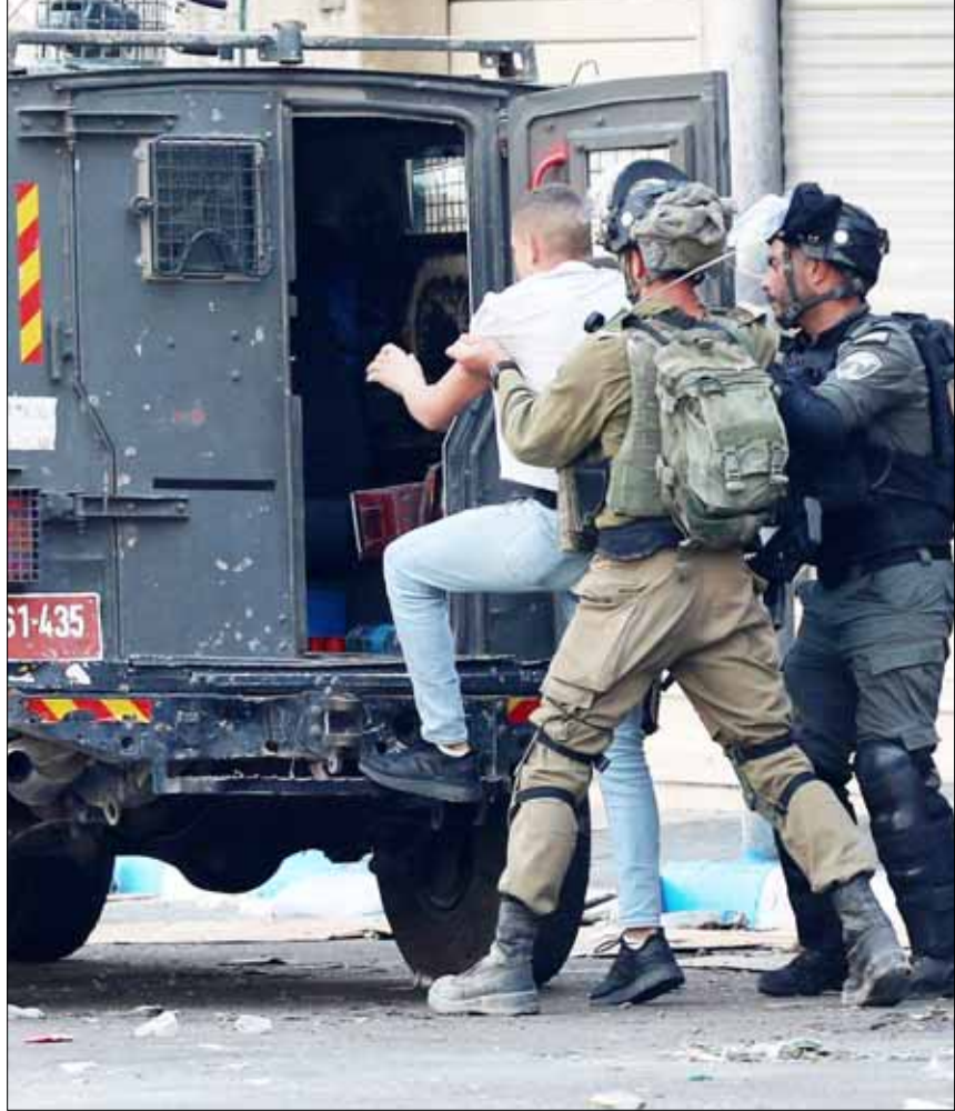
الفلسطيني " في بيان لها، بإصابة اثنين من طواقمها جراء اعتداء قوات الاحتلال عليهما بالضرب في بلدة قباطية جنوبي جنين.