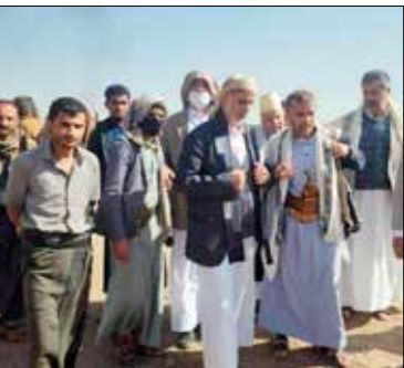
القائم بأعمال رئيس الوزراء يدشن العمل بمشروع بحيرة مائية لحصاد مياه الأمطار والسيول