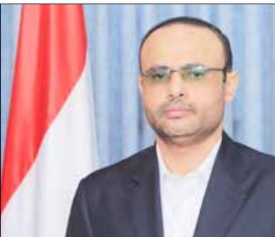
الرئيس المشاط يعزي في وفاة الشيخ أحمد عبدالله ناصر دغيش

الأربعاء: 27 جمادى الآخرة 1447هـ | 17 ديسمبر 2025م | العدد 342 | 12 صفحة | السنة الخامسة